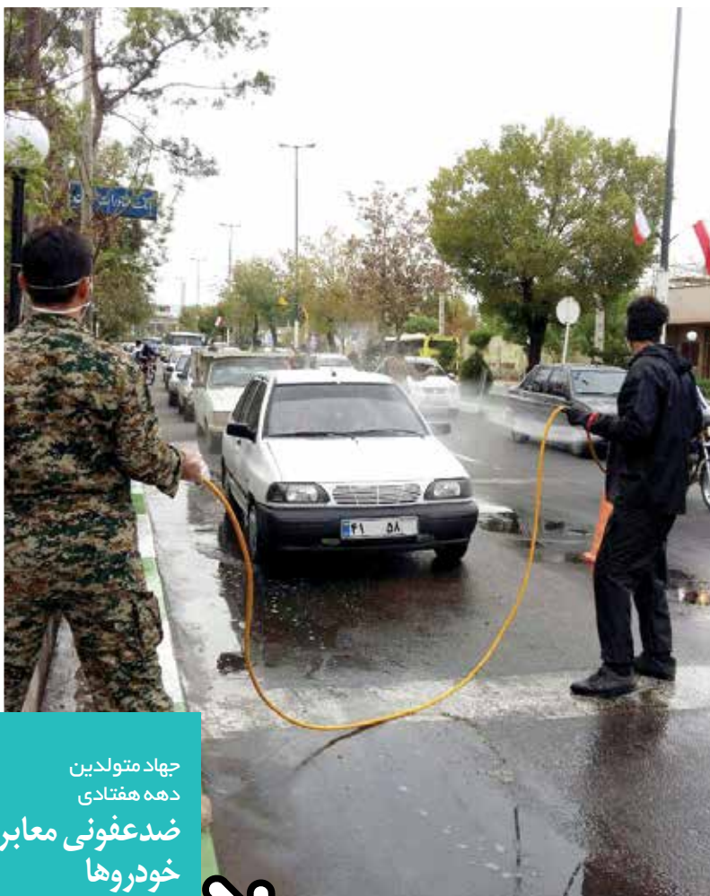
جهاد متولدین دهه هفتادی ضد عفونی معابر و خودروها