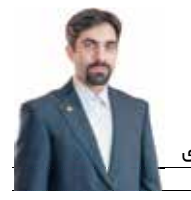
سید مصطفی موسوی شهردار منطقه ۹