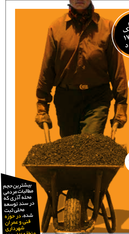
بیشترین حجم مطالبات مردمی محله آذری که در سند توسعه محلی ثبت شده، در حوزه فنی و عمران شهرداری منطقه ۱۷ بوده است.

بیشترین حجم فعالیت‌های عمرانی در ناحیه یک انجام شده و در حوزه نهرسازی بوده است.