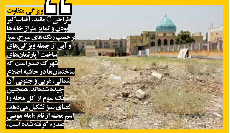
ویژگی متفاوت طراحی مانند، آفتاب گیر بودن و تمایز متر از خانه‌ها بر حسب رنگ‌های سرخ، سبز و آبی از جمله ویژگی‌های ساخت آپارتمان‌های شهرک صدراست که ساختمان‌ها در حاشیه اضلاع شمالی، غربی و جنوبی آن چیده شده‌اند. همچنین یک سوم از کل محله را فضای سبز تشکیل می‌دهد. اسم محله از نام «امام موسی صدر» گرفته شده است.

ساکنان از این موضوع گله دارند و می‌پرسند «چگونه سازنده‌ای که به وعده‌های خود عمل نکرده است، دوباره مجوز ساخت به او می‌دهند.» در مرحله نخست باید این شرکت به تعهدات خود در قبال تأمین سرانه‌ها و فضاهای آموزشی، فضای سبز و ورزشی عمل کند. این موضوع می‌تواند در روند اجرای طرح‌های دیگر هم تأثیر بگذارد. هنوز مراحل اجرا و عملیات این پروژه آغاز نشده است، ولی امتیاز خرید و فروش این واحدها، از ۳۰۰ تا ۴۰۰ میلیون تومان به فروش می‌رسد. هم‌چنین اجازه برای ساخت در این محدوده مختلف است. برای مثال، در اطراف خیابان «هکده المپیک»