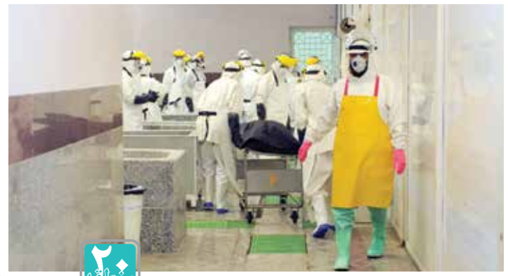
همراه با زوج تطهیر کننده متوفیان کرونایی