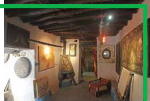
موزه رازها، توقفگاه کوهنوردانی که به دنبال هویت محله قدیمی می گردند