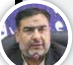
سید مهدی ساداتی فرماندار استان شمیرانات

ویروس منحوس کرونا بعد از گذشت ماه‌ها از شیوع ویروس کرونا در جهان منجر به صدمات غیرقابل جبرانی شده و تلاش بی‌وقفه کشورهای مختلف در تولید واکسن متأسفانه تاکنون منتج به نتیجه نشده است. دستورالعمل‌های ابلاغی از سوی ستاد ملی مبارزه با کرونا و رعایت بهداشت فردی و استفاده از ماسک تا امروز بهترین راهکار در کنترل این ویروس ناشناخته است