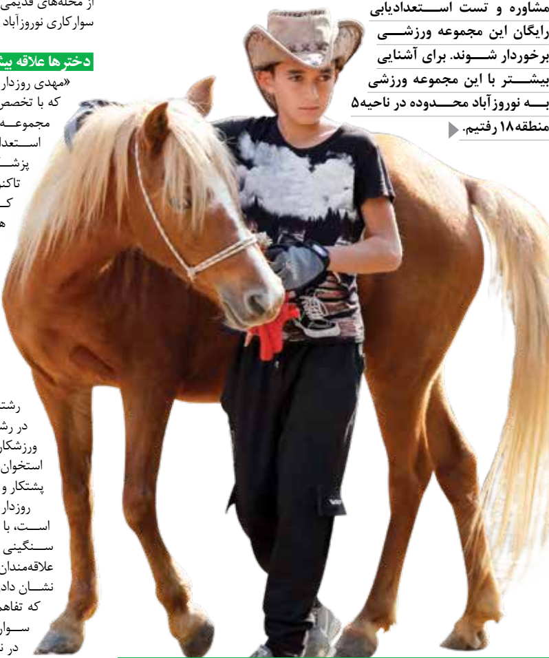
مربی باشگاه سوارکاری نوروز آباد: