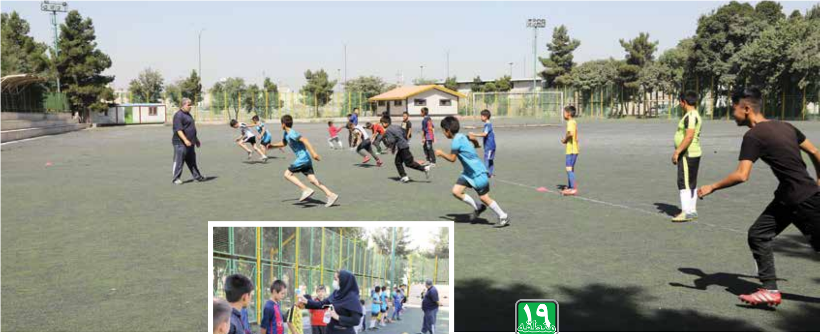
مهرمن فاسمی گزی

شرايطی هم که شیوع ویروس کرونا به وجود آورده، باعث شده کلاس‌های سال تحصیلی آینده نیز به‌صورت نیمه حضوری و آنلاین برگزار شود. بنابراین برای دانش آموزان تفاوتی ندارد در کدام مدرسه درس بخوانند.» وی در پایان می‌گوید: «باید تلاش کنیم وضعیت آموزشی را در بخش مدرسه و فضای مجازی ارتقا دهیم تا فرزندانمان شرایط مطلوبی برای رشد و پیشرفت داشته باشند. به والدین دانش آموزان و نمایندگان مدرسه امید امام(ره) اطمینان می‌دهیم که هر تصمیمی در حوزه آموزش و پرورش، طبق اصول و مصلحت تربیتی و آموزشی است و اجرای این برنامه‌ها فضای مناسبی را برای رشد آینده‌سازان کشور فراهم می‌کند.»