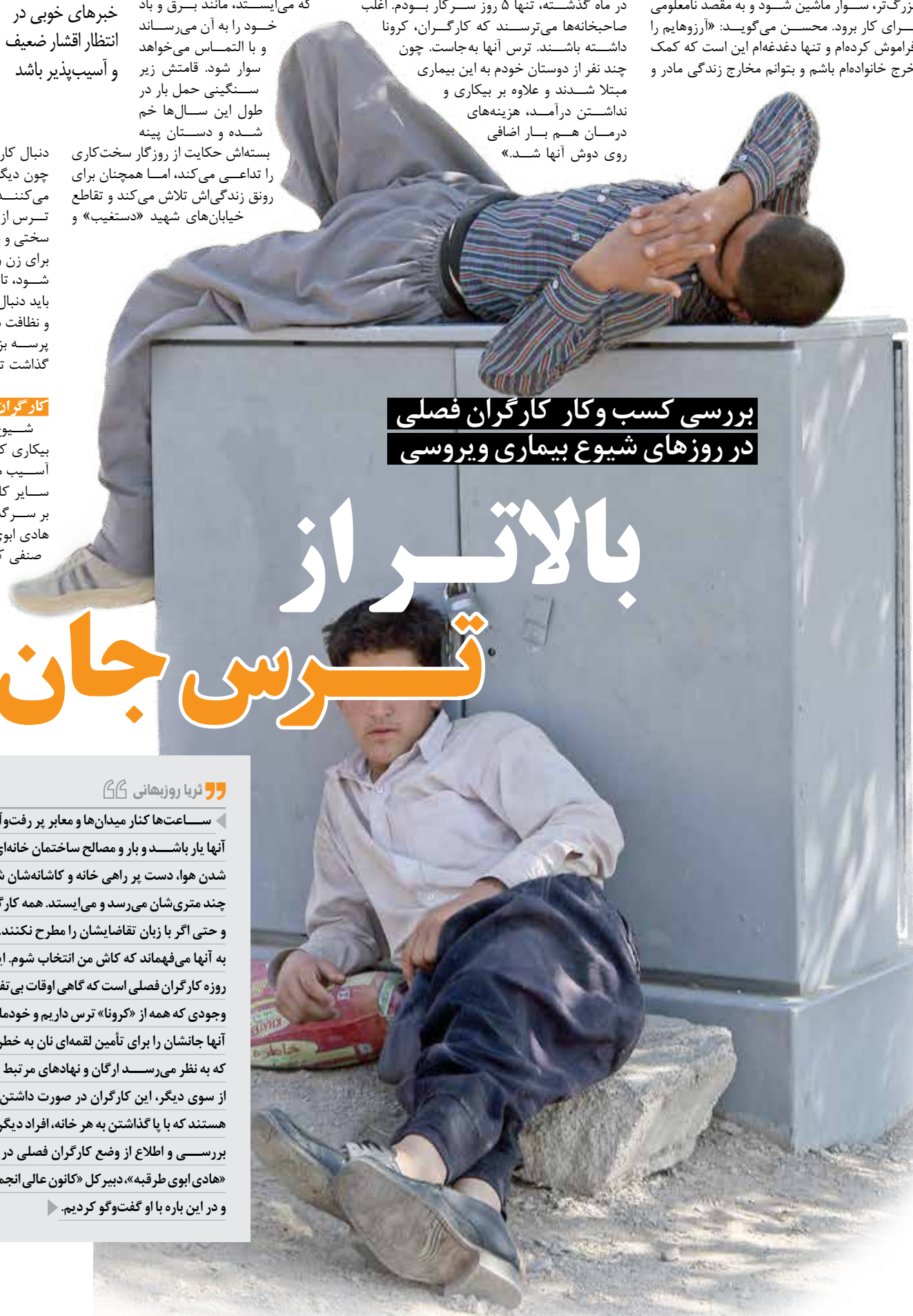
بررسی کسب و کار کارگران فصلی در روزهای شیوع بیماری ویروس

۴خواهر و برادرم را تأمین کنم. برای همین، دیگر از کرونا ترسی ندارم و هر کاری که بتوانم انجام می‌دهم. از اسباب‌کشی خانه‌های مسکونی گرفته تا کارهای خدمات، نظافت ساختمان یا آماده کردن ملات برای پنا. بازار ساخت وساز در بهار و تابستان حسابی داغ است و اغلب کارگران بیکار نمی‌مانند، اما از اسفندماه سال گذشته به سبب کرونا، کارهای نظافت منزل بسیار کم بود و در حال حاضر هم کم‌تر سازنده‌های سراغ کارگران سرچهارراه‌ها می‌آید. در ماه گذشته، تنها ۵ روز سرکار بودم. اغلب صاحبخانه‌ها می‌ترسند که کارگران، کرونا داشته باشند. ترس آنها به‌جاست. چون چند نفر از دوستان خودم به این بیماری مبتلا شدند و علاوه بر بیکاری و نداشتن درآمد، هزینه‌های درمان هم بار اضافی روی دوش آنها شد.»