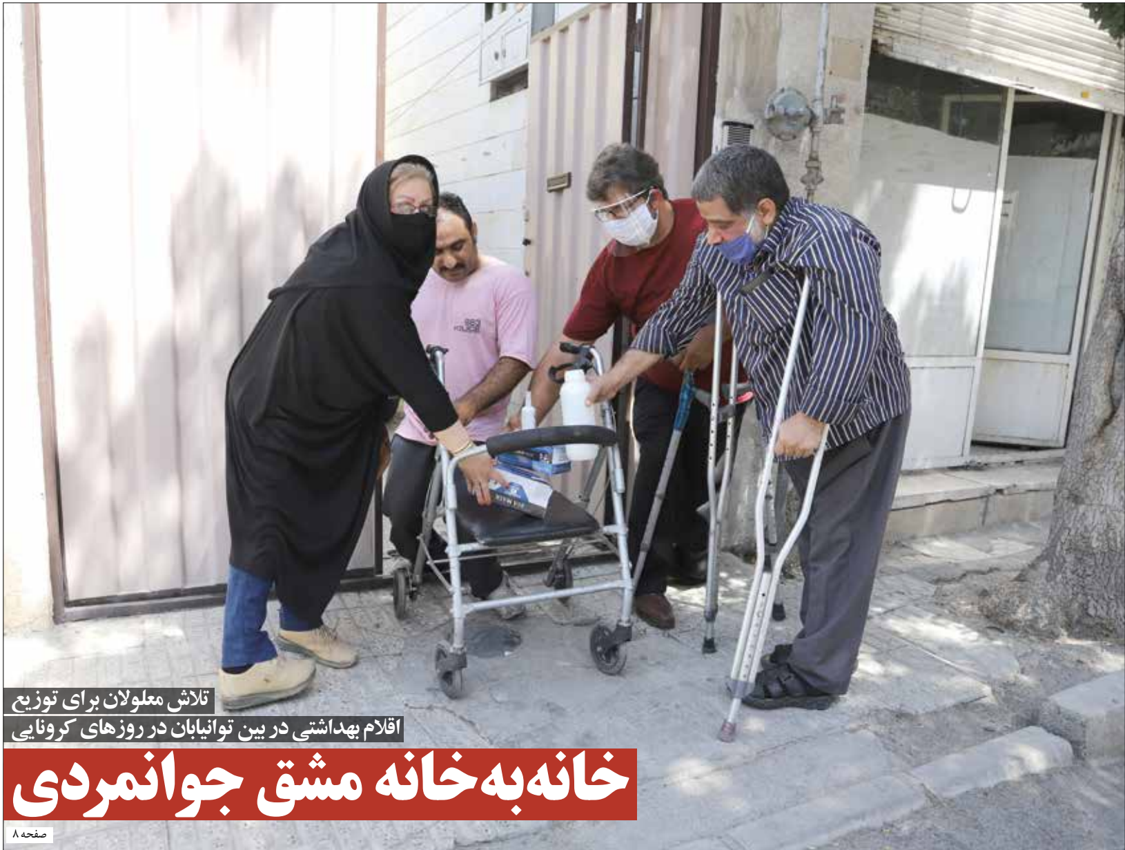
تلاش معلولان برای توزیع اقلام بهداشتی در بین توانیابان در روزهای کرونایی