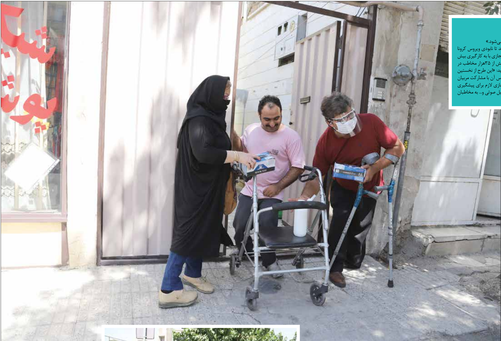
تلاش معلولان برای توزیع اقلام بهداشتی در بین توانیابان در روزهای کرونایی

در مرکز توانبخشی کوثر برای بچه‌های دارای معلولیت ذهنی در ۱۴ اسال، در مناسبت‌های مختلف همچون هفته معلولان و... نمایشگاه برگزار می‌کنم. ابتدا به آموزش ساخت گل‌های چینی می‌پرداختم بعد هویه کاری، مارشال‌دوزی، روبان‌دوزی و گلدوزی هم به آن