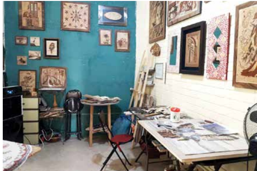
نخستین مرکز حرفه‌ای کار آفرینی شهر تهران در محله استادمعین راهاندازی شد