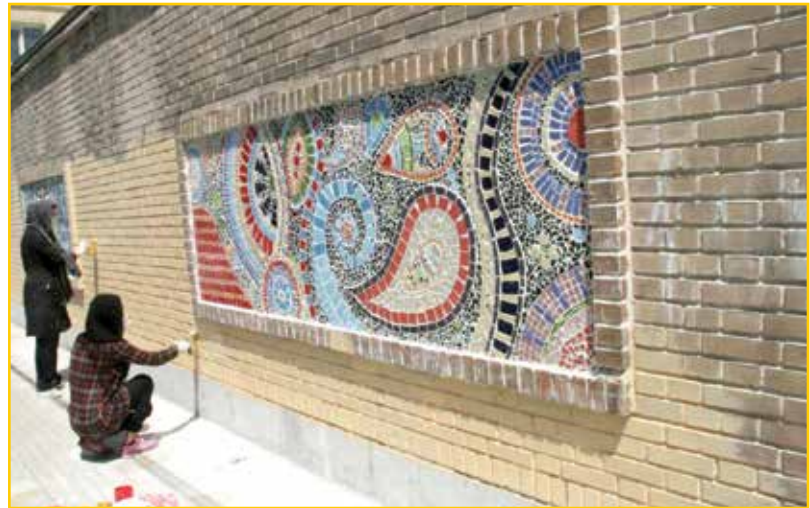
معارب منطقه ۹ با اجرای طرحی متفاوت نونوار می شوند