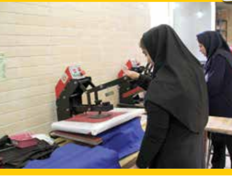
کاهش آسیب‌های اجتماعی با مشارکت مردم

خیابان اجتماعی، اقدام مؤثر فرهنگی بهربرداری از خیابان «اجتماعی» منطقه، نقطه عطفی در حذف نگاه عمرانی و سازه‌محور است که