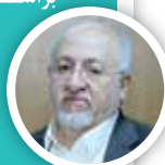
محمدجواد حوشناس رئیس کمیته نامگذاری شورای اسلامی شهر تهران

براساس قانون نامگذاری معابر و مکان‌های شهر تهران جزو وظایف شوراست که قاعده و قوانین خاص خودش را دارد. در دوره پنجم شورای اسلامی شهر تهران نام‌های معابر تهران از طریق سیستم داده‌پردازی شناسایی و مورد توجه قرار گرفته و براساس اطلاعات دقیقی به دست آمده است.