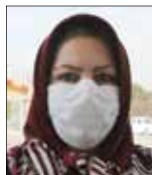
ریاضه میانایی ساکن محله

پارک آموزش ترافیک منطقه ۱۹ در انتهای بلوار شقایق، در کندرو بزرگراه شهید کاظمی قرار گرفته و دسترسی محلی به آن از طریق خیابان های رازی، لقمان و بخشنده محله شکوفه است. معمولاً کودکان مخاطبان اصلی پارک های آموزش ترافیک هستند، اما با تعطیلی مدارس در روزهای شیوع کرونا، جای آنها در پارک آموزش ترافیک خالی است و برخی از بانوان میانسال و سالمند که از ۲ سال پیش با اجرای طرح آموزش دوچرخه سواری به بانوان ۵۰ تا ۷۰ ساله عضو ثابت اینجا هستند مخاطبان اصلی این پارک شده اند. ساعت از ۹ گذشته است، بانوان ماسک به صورت زده اند و با رعایت فاصله اجتماعی، یکی یکی در کلاس دوچرخه سواری حاضر می شوند. بانوی جوانی که مربیگری این کلاس را به عهده دارد، دوچرخه ها را روی خطی صاف چیده و با کوبیدن دست هایش به یکدیگر بانوان را به حضور هر چه سریع تر در کلاس تشویق می کند. اشتیاق خاصی در نگاه بانوان است و از وجود چنین امکانی در محله شان شکر گزارند.