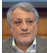
محسن هاشمی رئیس شورای اسلامی شهر تهران

نامه مکتوب ساکنان محله باغ آذری از طریق شورایی به دست اعضای شورای اسلامی شهر تهران رسیده است تا در این زمینه اقدام کنند. «محسن هاشمی» رئیس شورای اسلامی شهر تهران در این باره به خبرنگار همشهری محله می‌گوید: «خواسته شهروندان محله باغ آذری مبنی بر جلوگیری از راه‌اندازی گرمخانه معنادران متجاهر با دقت در دست بررسی است و به‌زودی کمیسیون‌های مربوطه در این باره نتیجه را بیان خواهند کرد.» هاشمی کاهش مشکلات مردم را یکی از اهداف اصلی اساسی برای رسیدن به شعار حقوق شهروندی می‌داند و می‌گوید: «مردم حق دارند که درباره طرح‌ها و پروژه‌هایی که در محل زندگی‌شان اجرا می‌شود اظهار نظر کنند، گاهی وقت‌ها توجه به همین دیدگاه‌ها و ایده‌های شهروندان از بروز مشکلات در آینده جلوگیری می‌کند.» رئیس شورای اسلامی شهر تهران تأکید می‌کند: «اعضای شورای شهر با قاطعیت مدافع حقوق شهروندان هستند، بنابراین هیچ نگرانی در این زمینه وجود ندارد و به‌زودی این گرمخانه تعیین تکلیف خواهد شد.»