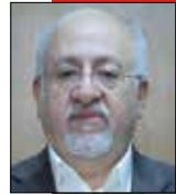
محمدحسین غسملو رئیس شورای اسلامی شهر تهران