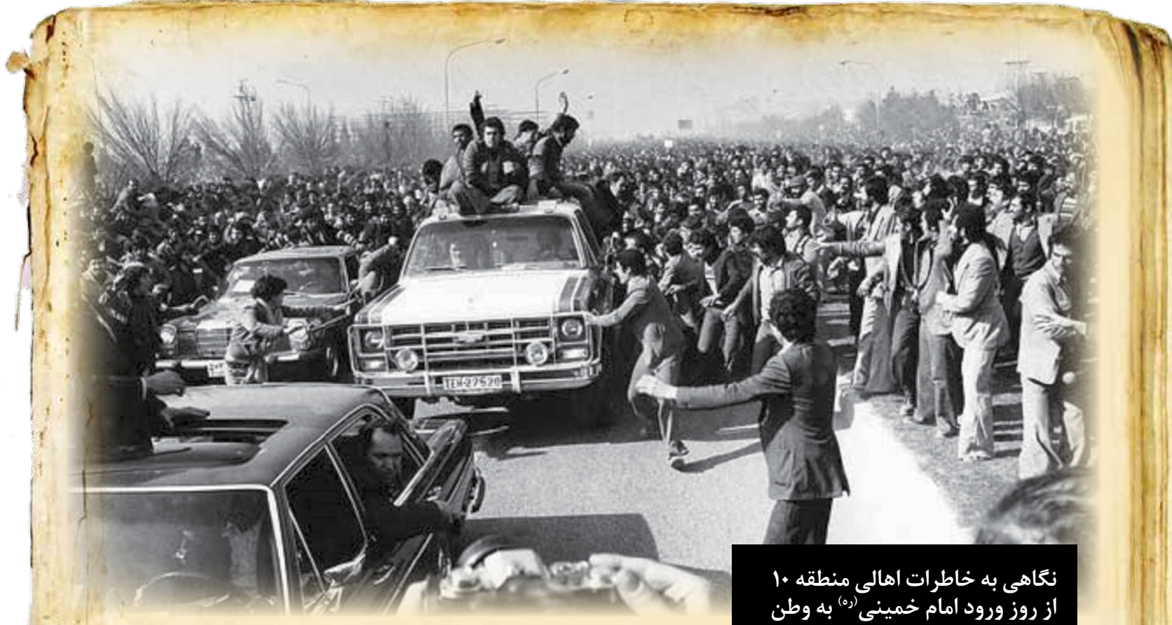
نگاهی به خاطرات اهالی منطقه ۱۰ از روز ورود امام خمینی (ره) به وطن