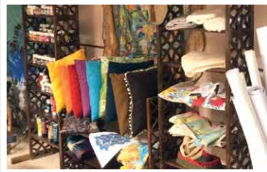
گفت‌وگو با بانوان موفق کارآفرین هم‌محله‌ای به مناسبت روز زن