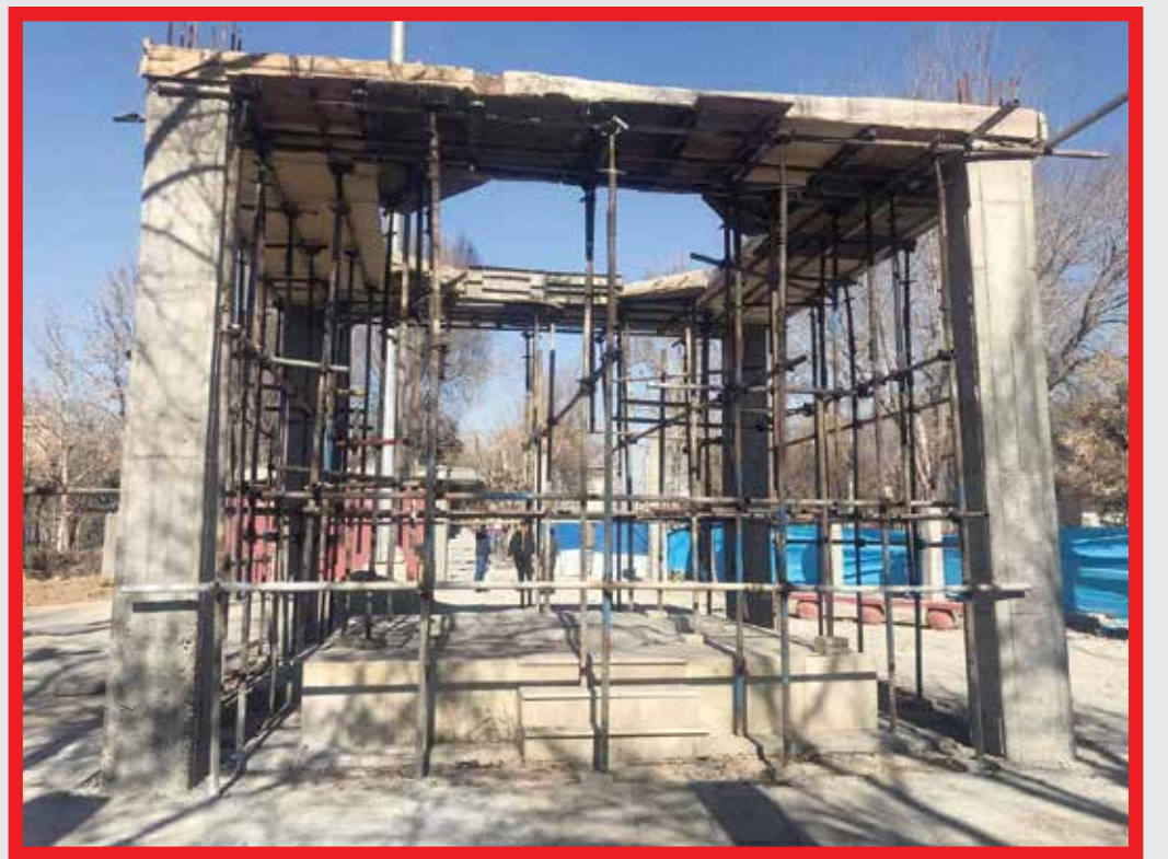
ساخت المان مقبره شهدا زده شد که تاکنون ۴۵ درصد پیشرفت در ساخت سازه داشته است

کمتر شهورندی در منطقه ۱۵ پیدا می‌شود که بوستان گلزار در محله مطهری را نشناسد. در فاصله سال‌های ۸۹ تا ۹۳ آوازه جرم‌خیزی این بوستان به گوش اکثر شهروندان منطقه رسیده بود. شرایط در این بوستان محلی به گونه‌ای بود که بستر وقوع اغلب جرائم و بزه‌ها در آن فراهم بود و اهالی محله مطهری و محله‌های همجوار از این موضوع ناراضی بودند. از حضور و تردد افراد معتاد و ارادل و اوباش گرفته تا استعمال موادمخدر در مقابل دید اهالی و درگیری و نزاع‌های دسته‌جمعی، بوستان گلزار را به محل نامنی برای خانواده‌ها تبدیل کرده بود. اما این شرایط برای همیشه ماندگار نشد و در سال‌های اخیر با اقداماتی که با همکاری شورایی و اهالی محله انجام شد این بوستان به محل امنی برای خانواده‌ها تبدیل شده است. اقداماتی مانند جانی پلیس کانکس پلیس افتخاری، تدفین شهدای گمنام داخل بوستان و تدارک برنامه‌های مختلف فرهنگی باعث شد چهره این بوستان تغییر کند.