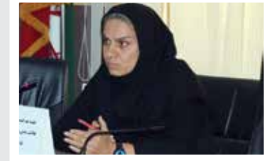
مدیر اداره ورزش بانوان منطقه ۱۴ : ورزش کنید تا سلامت بمانید

به گفته مدیر اداره ورزش بانوان منطقه ۱۴، بعضی از شهروندان هزینه کلاس‌های ورزشی و کمبود وقت را بهانه و از حضور در برنامه‌های ورزشی خودداری می‌کنند. در صورتی که می‌توانند برای حل این دغدغه در ایستگاه‌های تندرستی شرکت کنند. او می‌گوید: «۴۲ ایستگاه تندرستی ویژه بانوان در بوستان‌ها و مجموعه‌های ورزشی منطقه ۱۴ برپاست.