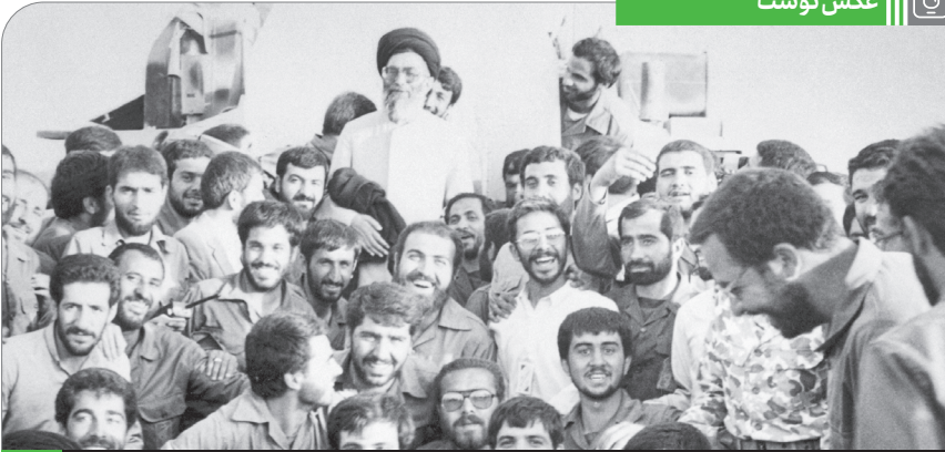
حضور حضرت آیت الله خامنه‌ای در جمع پاسداران واحد توپخانه سپاه پاسداران انقلاب اسلامی

پاسداران برای خدا مجاهدت کردند. روز پاسدار، روز ولادت حسین بن علی علیه السلام است؛ یعنی مظهر مجاهدت خالص و پاک برای خدا. این مجاهدت اگر از سوی مردم جواب داده شد، مثل مجاهدت نبی اکرم میشود که حکومت اسلامی را به وجود آورد و تاریخ را عوض کرد؛ اما اگر با کمک و همراهی دلهای مؤمن مواجه نشود، مانند واقعه عاشورا میشود که امام حسین به شهادت میرسد. ● ۱۳۸۱/۰۷/۱۷