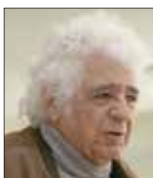
لوریس چکنواوریان رهبر ارکستر و آهنگساز

ایده راهاندازی موزه موسیقی نخستین بار توسط علی مرادخانی در شهرداری تهران مطرح شد. مدیریت این موزه را خودش برعهده گرفت و از سال ۱۳۷۸ آن را اداره می‌کرد. چکنواوریان که در مراسم رسمی آثار خود در حوزه موسیقی را به موزه اهدا کرد می‌گوید: «با افتخار می‌توان گفت موزه موسیقی ایران موزه‌ای درجه یک است که به وسیله آقای مرادخانی تأسیس و مدیریت شد. حفظ و نگهداری آثار قدیمی موسیقی ایران تنها یکی از کارهایی بود که در این موزه انجام گرفت. همچنین آشناسان کردن مخاطبان موزه با موسیقی اقوام و موسیقی‌های نواحی. علی مرادخانی در زمان حیات خود