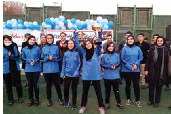
راه اندازی نخستین باشگاه فوتبال چمنی بانوان پایتخت در منطقه ۲۱