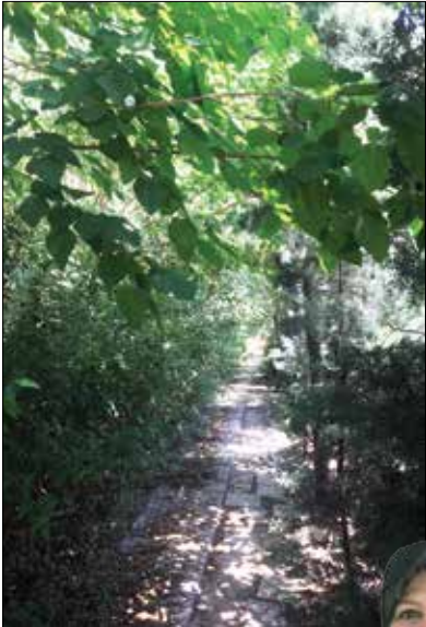
درخت‌هایی که ۳۵ سال قبل توسط پدر مریم مددی کاشته شده است

شهروند نمونه گل و گیاه شهرک فرهنگیان، از فضای داخل