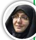
زهره صدراعظم نوری رئیس کمیسیون سلامت شورای شهر تهران