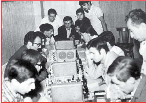
مسابقات شطرنج باشگاه آرارات دهه ۸۰

سی تیر بود، اما زمین ۷۴ هزارمترمربعی محدوده محله ونک برای ساخت این مجموعه فرهنگی، ورزشی اختصاصی در نظر گرفته شد. انتخاب این زمین در محله ونک به ماجرای ورود نخستین خانواده‌های ارمنی به محله ونک و ساخت قلعه ارمنه در این محدوده ارتباط دارد. زمانی می‌گوید: «نام ونک ارمنه هنوز هم میان ساکنان قدیمی ونک و به‌ویژه محدوده ورزشگاه آرارات رایج است. روزگاری که آبادی ونک یکی از ۳۳ پارچه‌آبادی شمیران به حساب می‌آمد و به جای برج‌ها و ساختمان‌های امروزی تا چشم کار می‌کرد همه جا پر از زمین زراعی بود، نخستین خانواده‌های ارمنی به این محدوده کوچ کردند. میرزا آقاسی صدراعظم محمد شاه ۱۲ خانواده ارمنی را از چهارمحال و بختیاری برای کشاورزی به تهران آورد. سپس برای آن ۱۳ خانواده در نزدیکی زمین‌های کشاورزی، قلعه‌ای ساخت که با سکونت آنها پخش شرقی‌آبادی ونک به ونک ارمنه مشهور شد.» هنوز هم بقایای کاھلگی یکی از ۴برج نگهبانی قلعه کشاورزان در شرق ورزشگاه آرارات و در انتهای کوچه امید دیده می‌شود. زمانی ادامه می‌دهد: «جمعیت ساکن در قلعه کشاورزان در دهه ۴۰ و همزمان با سال‌های پایانی فعالیت قلعه به قریب به ۲۰۰ نفر هم رسیده بود. در سال‌های فعالیت قلعه ارمنه، کلیسایی برای کشاورزان ساخته شد تا این محدوده بیش از پیش با نام ونک ارمنه شهرت پیدا کند. مقابل در ورودی قلعه هم قلعه زمینی در تملک ارمنه بود که جوانان ساکن در قلعه از آن زمین برای انجام فعالیت‌های ورزشی و اجتماعات فرهنگی استفاده می‌کردند. وقتی قرار شد زمینی برای ساخت مجموعه فرهنگی، ورزشی آرارات در نظر گرفته شود، قطعه زمین مقابل قلعه ارمنه بهترین گزینه برای ساخت این مجموعه بزرگ بود.»