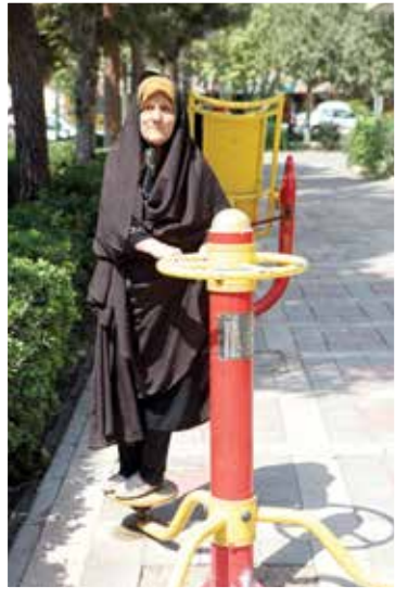
معاون فرهنگی و اجتماعی شهردار منطقه ۲۱

بیگی می‌افزاید: «از آنجایی که با افزایش سن و در دوران بازنشستگی معمولا علائم آنزوا و افسردگی بیش از پیش در افراد جامعه دیده می‌شود، شهرداری منطقه با ایجاد پلازای «هنر کمال‌الملک» و توسعه و ساماندهی فضاهای تعاملی و باتوق‌های محلی، به دنبال ایجاد مکان‌هایی است که سالمندان و افراد بازنشسته در محله‌های مختلف بتوانند در آنجا دور هم جمع شوند تا