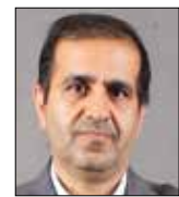
محمود ضا‌جوادی یگانه معاون امور فرهنگی و اجتماعی شهرداری تهران