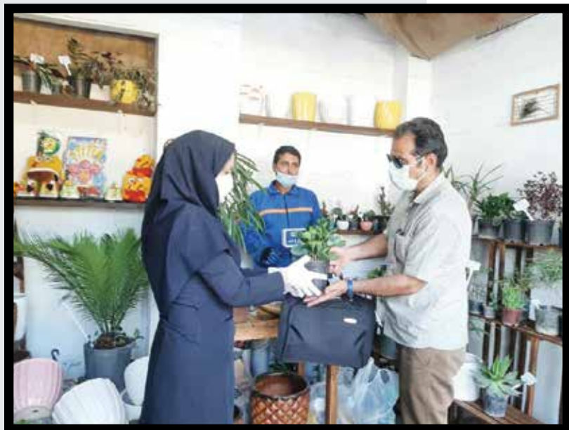
نخستین مرکز گل‌ماند منطقه ۹ در محله امامزاده عبدالله (ع) افتتاح شد