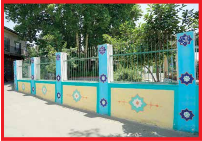
«کوچه دوستی» به محله کن رسید