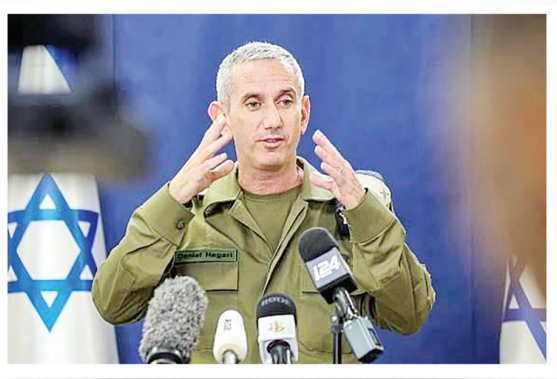
شروع دروغ سازی های رژیم صهیونیستی

خواهش حامیان صهیونیست ها از ایران برای عدم پاسخ از صبح امروز تلاش حامیان صهیونیست ها برای متقاعد کردن ایران به پاسخ ندادن شروع شده است. رسانه العربیه به نقل از یک مقام آمریکایی نوشت که آنچه اتفاق افتاد باید پایان رویارویی اسرائیل و ایران باشد. گاردین هم نظر دولت انگلیس را این طور منتشر کرد که از ایران و اسرائیل می خواهیم از تشدید تنش اجتناب کنند. سخنگوی شورای امنیت ملی آمریکا هم گفته است ایران نباید به اسرائیل پاسخ دهد تا این چرخه جنگ بدون تشدید و وضعیت، متوقف شود.