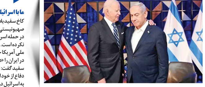
ما با اسرائیلی ها نیستیم

شروع دروغ سازی های رژیم صهیونیستی صهیونیست ها بلافاصله دروغ سازی و عملیات روانی خود را آغاز کردند. یک منبع مطلع در کشور گفته است که ادعای ارتش اسرائیل مبنی بر هدف قرار دادن ۲۰ نقطه در کشور غیر واقعی است و تعداد اهداف دشمن با فاصله، کمتر از این میزان است. وی تاکید کرده که هیچ مرکز نظامی سپاه در تهران مورد هدف قرار نگرفته است. اخباری که می گوید ۱۰۰ هواپیمای نظامی اسرائیل در این حمله نقش داشتند نیز کاملاً دروغ است و اسرائیل به دنبال بزرگ نمایی حمله ضعیف خود است.