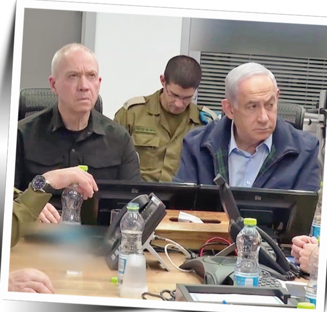
مقامات صهیونیستی در بناهای زیر زمینی

شبکه المیادین گزارش داد: «پیام تهدیدآمیز اسرالی ایران از طریق میانجی گران، در بازدارندگی اسرائیل برای عبور از خطوط قرمز ایران موفق عمل کرد.» این شبکه بین المللی همچنین اعلام کرد: «پدافند هوایی ایران حملات متعدد اسرائیل به پایگاه های نظامی را خنثی کرد. هیچ حمله ای به زیرساخت های حیاتی ایران صورت نگرفت.» به گزارش شبکه آمریکایی NBC، «اسرائیل می گوید حمله به اهدافی در ایران را کامل کرده است.» به عبارتی دیگر، تهدیدهای اسرائیل علیه ایران در این نقطه پایان یافت.