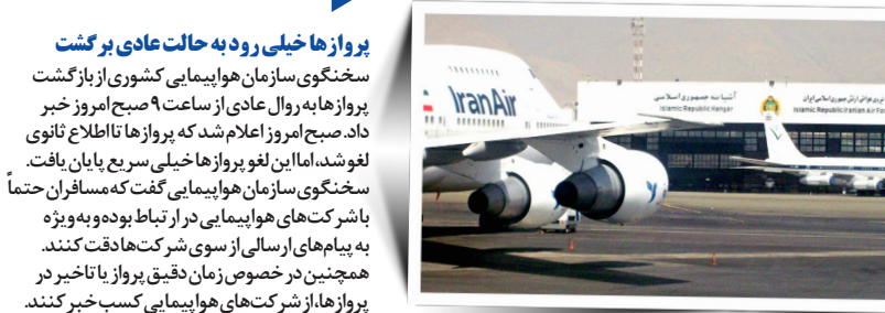
پروازها خیلی رود به حالت عادی برگشت

روند عادی زندگی مردم ایران مردم تهران، خوزستان و ایلام از صبح امروز روند عادی زندگی خود را در پیش گرفتند. سخنگوی وزارت آموزش و پرورش هم ابتدای صبح اعلام کرد که مدارس در کشور باز خواهد بود و جریان آموزش عادی است. پلیس راهور هم اعلام کرد که تردد در تمامی محورهای مواصلاتی کشور و معابر شهری و برون شهری عادی است و بدون مشکل جریان دارد. تصاویری هم بلافاصله در شبکه های اجتماعی منتشر شد که نشان از همین جریان عادی زندگی داشت.