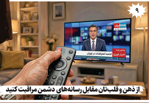
۹ از ذهن و قلب‌تان مقابل رسانه‌های دشمن مراقبت کنید

است. هدف، صرفاً مهار تهدید نیست؛ یعنی تبدیل منطقه از میدان حضور دشمن به عمق امنیتی خودی. مشارکت کشورهای منطقه را هم گرفتند. هشتم، نگاه یکپارچه به جبهه مقاومت اینچام، صرفاً جغرافیا نیست؛ این یعنی یک نگاه تمدنی به جنگ. نهم، تأکید بر مراقبت از ذهن‌ها میدان اصلی، ذهن انسان‌هاست. کنترل روایت، به معنای کنترل نتیجه جنگ