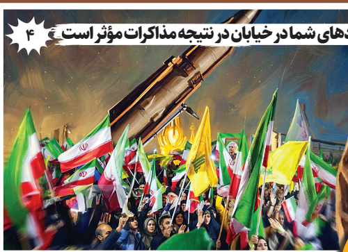
۴ فریادهای شما در خیابان در نتیجه مذاکرات مؤثر است