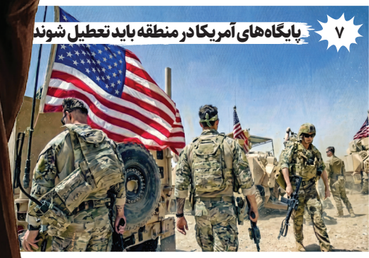
۷ پایگاه‌های آمریکا در منطقه باید تعطیل شوند