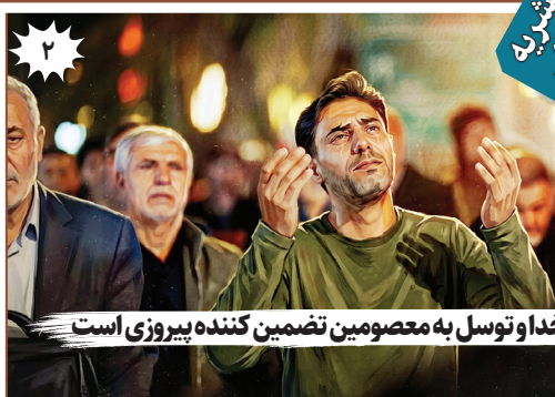
۲ یاد و توکل بر خدا و توسل به معصومین تضمین‌کننده پیروزی است

شروع مرمت ۶۵ بنای تاریخی آسیب‌دیده تهران