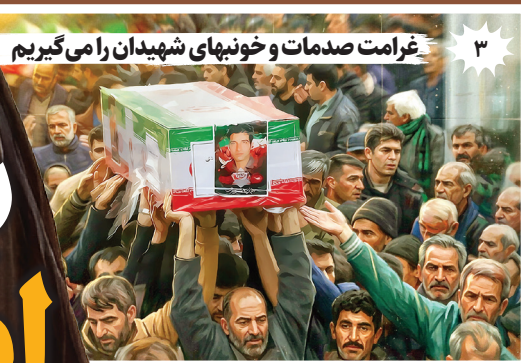
۳ غرامت صدمات و خونبهای شهیدان را می‌گیریم