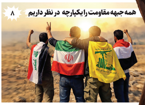
۸ همه جبهه مقاومت را یکپارچه در نظر داریم