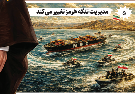
۵ مدیریت تنگه هرمز تغییر می‌کند