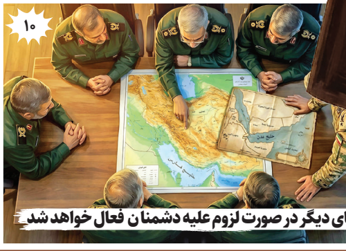
۱۰ جبهه‌های دیگر در صورت لزوم علیه دشمنان فعال خواهد شد