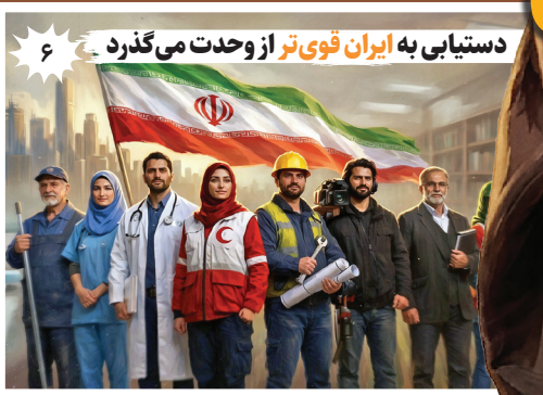
۶ دستیابی به ایران قوی‌تر از وحدت می‌گذرد