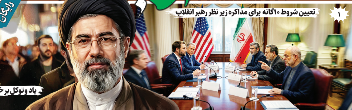
۱ تعیین شروط ۱۰ اگانه برای مذاکره زیر نظر رهبر انقلاب