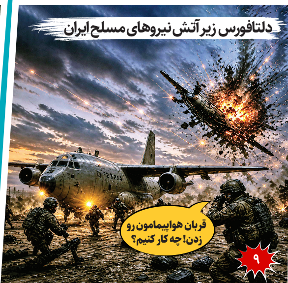
دلتافورس زیر آتش نیروهای مسلح ایران