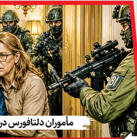
مأموران دلتافورس در