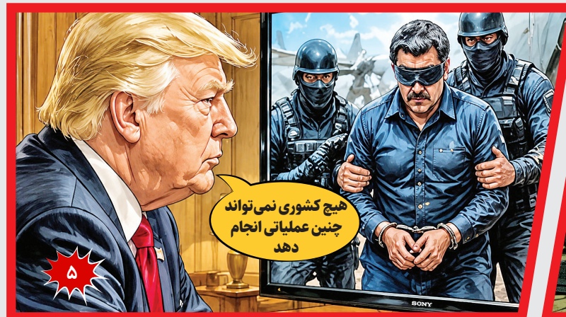
هیچ کشوری نمی‌تواند چنین عملیاتی انجام دهد