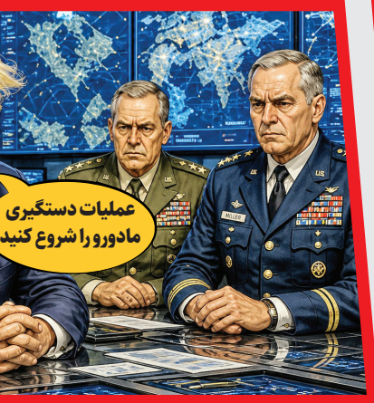
عملیات دستگیری مادورورا شروع کنید