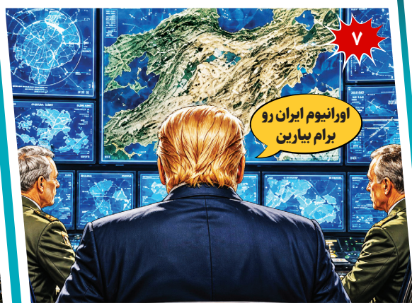
اورانیوم ایران رو برام بیارین