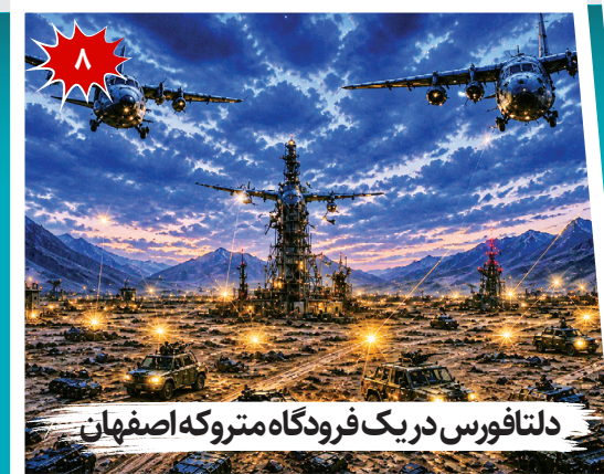
دلنافورس در یک فرودگاه متروکه اصفهان