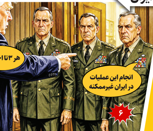
انجام این عملیات در ایران غیرممکنه