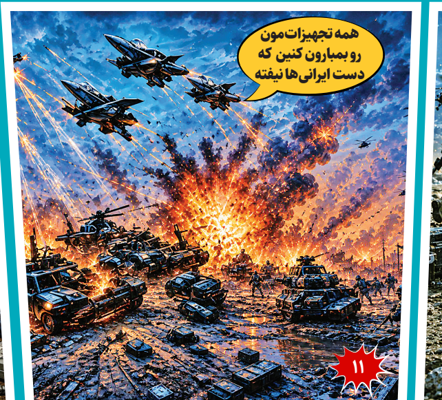
همه تجهیزات مون رو بمبارون کنین که دست ایرانی‌ها نیفته