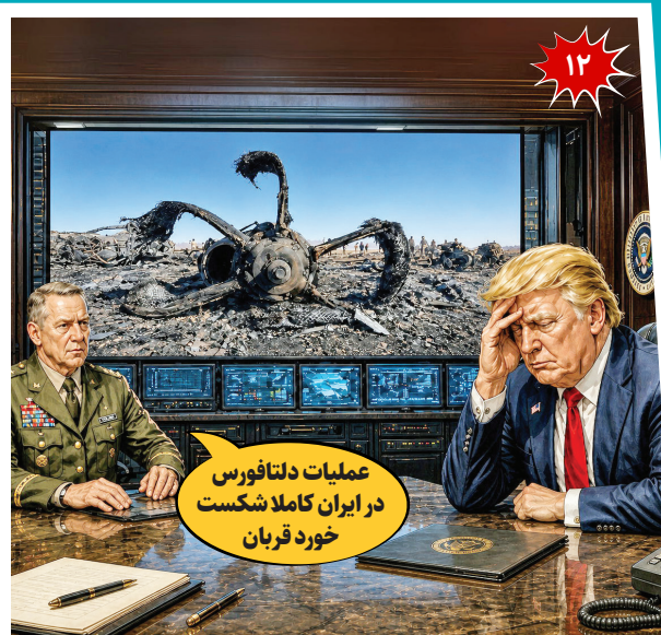
عملیات دلنافورس در ایران کاملاً شکست خورد قربان