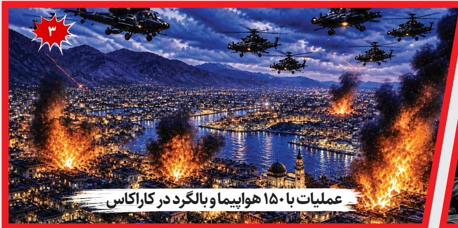
عملیات با ۱۵۰ هواپیما و بالگرد در کاراکاس

دیپلماتیک فو کونگ، سفیر و نماینده دائم چین در سازمان ملل و رئیس دوره‌ای شورای امنیت: حفظ آتش‌بس میان ایران و آمریکا ضروری است و مذاکرات باید با حسن نیت انجام شود.