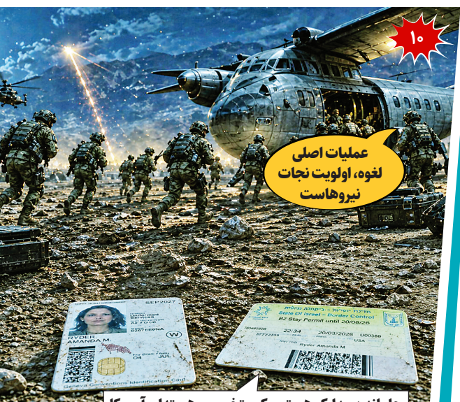
عملیات اصلی لغوه، اولویت نجات نیروهاست