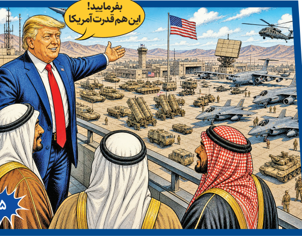
بفرمایید! این هم قدرت آمریکا!