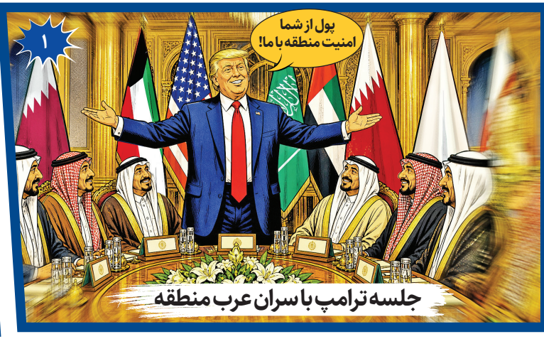
جلسه ترامپ با سران عرب منطقه