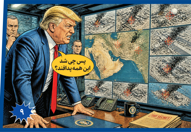
پس چی شد این همه پدافند؟