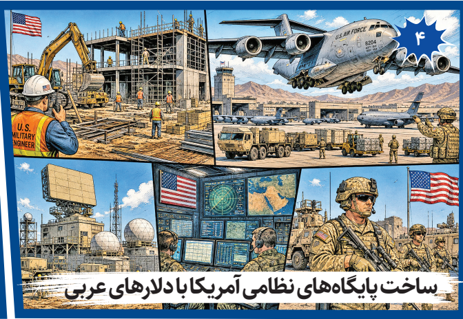
ساخت پایگاه های نظامی آمریکا با دلارهای عربی