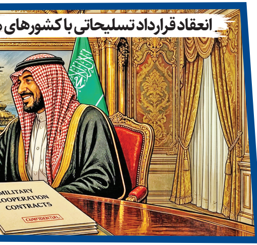
انعقاد قرارداد تسلیحاتی با کشورهای

انتظار داشت این درگیری کوتاه مدت و هزینه های محدودی داشته باشد، اما شرایط میدانی و سیاسی خلاف این پیش بینی ها را نشان داده است.