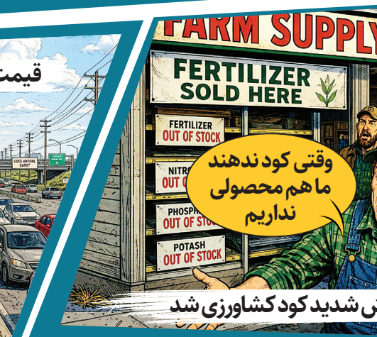
کشاورزان کود کشاورزی شد