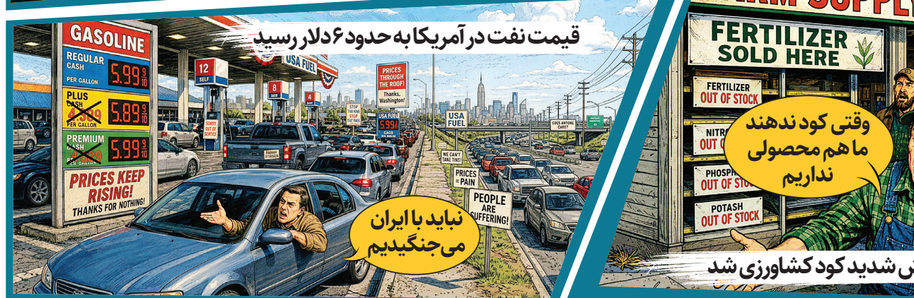
نباید با ایران می جنگیدیم