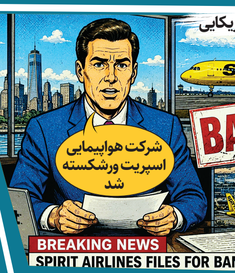
BREAKING NEWS SPIRIT AIRLINES FILES FOR BANKRUPTCY