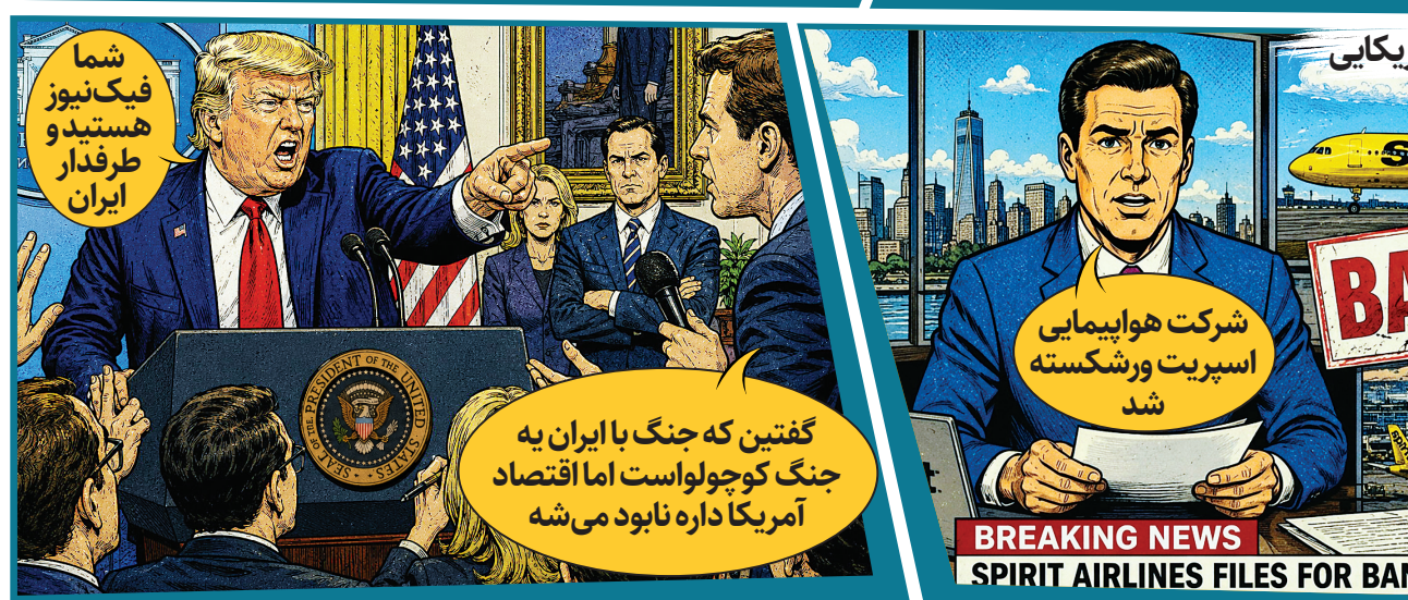
گفتین که جنگ با ایران به جنگ کوچولو است اما اقتصاد آمریکا داره نابود می شه