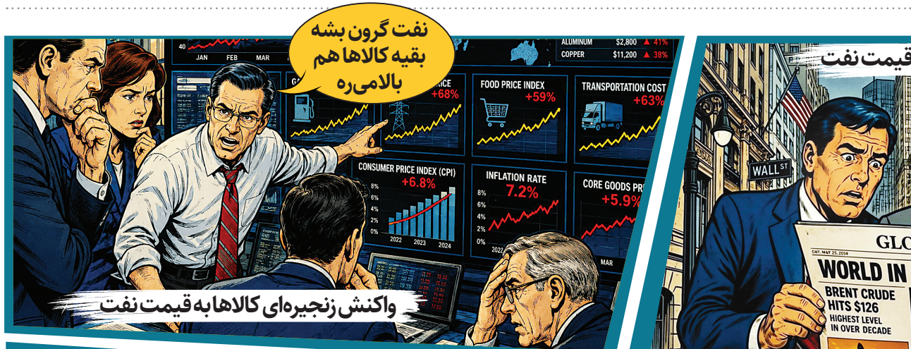
واکنش زنجیره ای کالاها به قیمت نفت