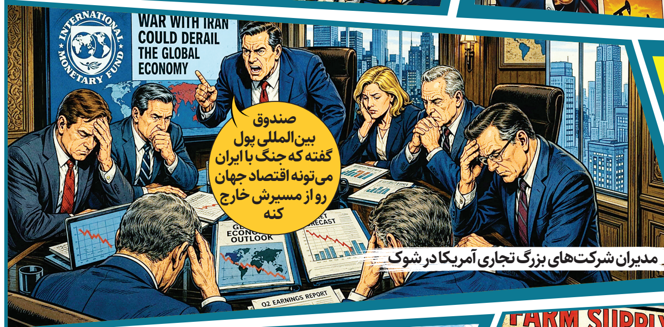
مدیران شرکت های بزرگ تجاری آمریکا در شوک