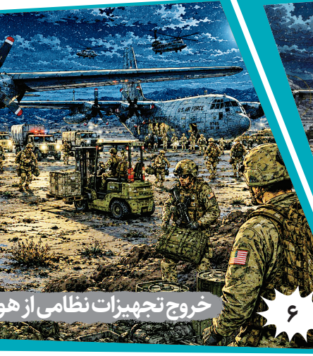
خروج تجهیزات نظامی از هو