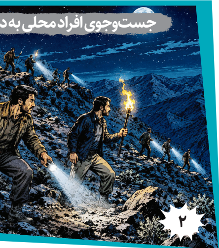
جست‌وجوی افراد محلی به

براساس داده‌های وبسایت «ردیابی هزینه‌های جنگ ایران»، هزینه‌های جنگ نظامی آمریکا علیه ایران تا روز هفتادویکم، از مرز ۷۷ میلیارد دلار فراتر رفته است. روش