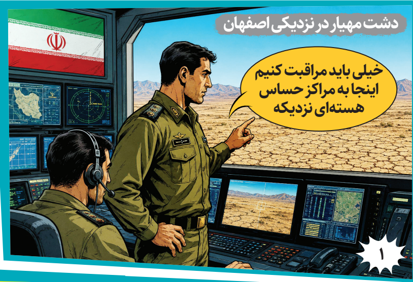
دشت مهبیار در نزدیکی اصفهان

خیلی باید مراقبت کنیم اینجا به مراکز حساس هسته‌ای نزدیکه