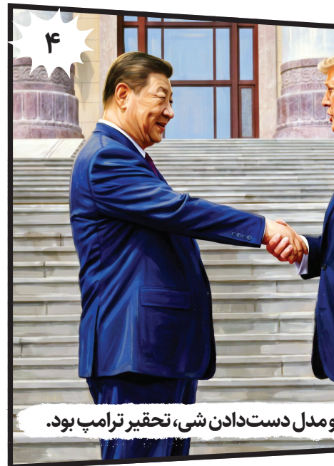
و مدل دست‌دادن شی، تحقیر ترامپ بود.