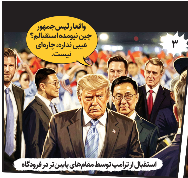
استقبال از ترامپ توسط مقام‌های پایین‌تر در فرودگاه