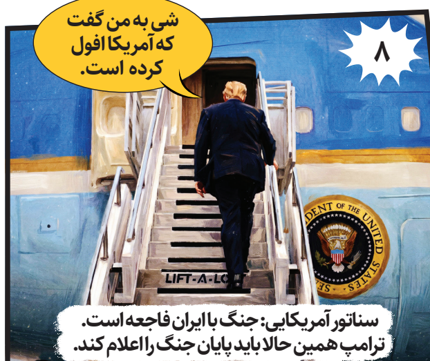
سناتور آمریکایی: جنگ با ایران فاجعه است. ترامپ همین حالا باید پایان جنگ را اعلام کند.