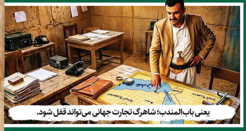
یعنی باب‌المندب؛ شاه‌رگ تجارت جهانی می‌تواند قفل شود.