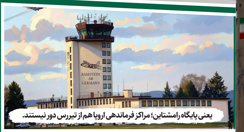
یعنی پایگاه رامشتاین؛ مراکز فرماندهی اروپا هم از تیررس دور نیستند.