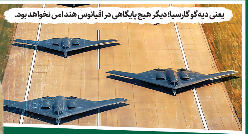
یعنی دیه‌گو گارسیا؛ دیگر هیچ پایگاهی در اقیانوس هند امن نخواهد بود.