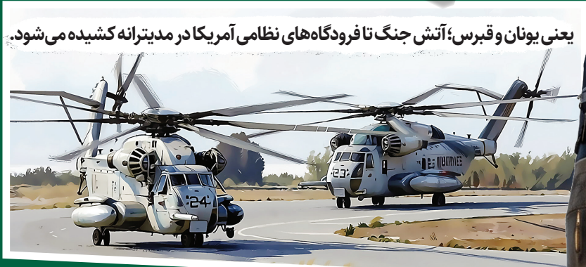
یعنی یونان و قبرس؛ آتش جنگ تا فرودگاه‌های نظامی آمریکا در مدیترانه کشیده می‌شود.