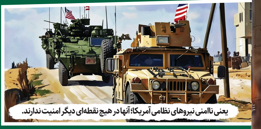
یعنی ناامنی نیروهای نظامی آمریکا؛ آنها در هیچ نقطه‌ای دیگر امنیت ندارند.