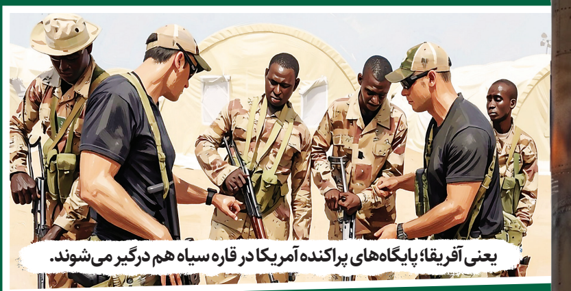
یعنی آفریقا؛ پایگاه‌های پراکنده آمریکا در قاره سیاه هم درگیر می‌شوند.

سپاه: جنگ منطقه‌ای با تکرار تجاوز به فراتر از منطقه کشیده خواهد شد