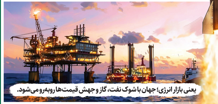
یعنی بازار انرژی؛ جهان با شوک نفت، گاز و جهش قیمت‌ها روبه‌رو می‌شود.