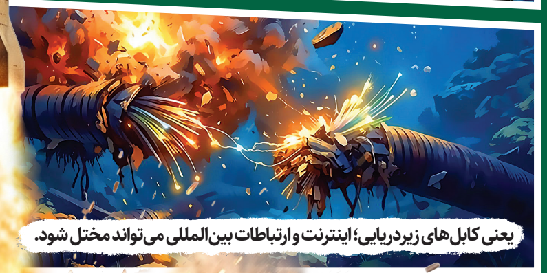
یعنی کابل‌های زیر دریایی؛ اینترنت و ارتباطات بین‌المللی می‌تواند مختل شود.