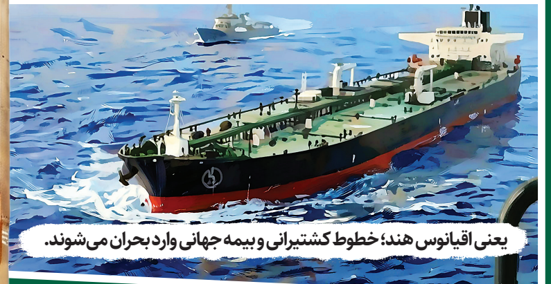
یعنی اقیانوس هند؛ خطوط کشتیرانی و بیمه جهانی وارد بحران می‌شوند.